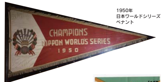
1950年 日本ワールドシリーズ ペナント

終戦後、プロ野球は1945年11月23日から東西対抗を実施。翌46年にはリーグ戦が復活した。50年、8球団によるセントラル・リーグ、7球団によるパシフィック・リーグが誕生、2リーグ制が始まった。この年、最初の日本シリーズが行われ、翌51年からオールスターゲームがスタート。