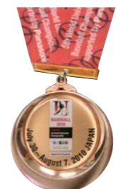
第5回世界大学野球選手権大会 銅メダル、日本代表サインボール 2010年日本で開催、日本代表は銅メダルを獲得。メンバーから斎藤、大石、伊志嶺ら8名がプロ入りした。