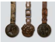
第17~19回大会 中京商3連覇時の参加賞メダル

1915年、全国中等学校優勝野球大会(現在の夏の甲子園大会)開催。1924年には全国選抜中等学校野球大会(現在の春の甲子園大会)も始まった。