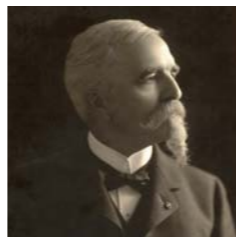
ホーレス・ウィルソン