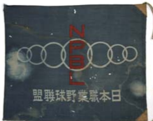
日本職業野球連盟 連盟旗

1936年2月、東京巨人、大阪タイガース、名古屋、東京セネタース、阪急、大東京、名古屋金鷲の7球団により日本職業野球連盟創立。初年度は巨人とタイガースが首位となり、洲崎球場で優勝決定戦が行われ、巨人が2勝1敗で優勝。