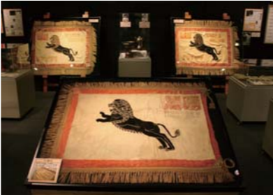
都市対抗の優勝チームに授与される黒獅子旗

1927年の第1回から73年まで使われていた初代黒獅子旗(手前)。小形放庵が、パピロンのレリーフにヒントを得てデザインした。現在は3代目が使われており、都市対抗開催期間中は3代そろって展示予定。