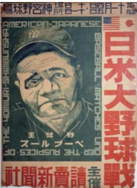
1934年日米野球 ポスター

1934年11月ペーブ・ルースら米大リーグ選抜チームは全日本チーム等と16戦を行い全勝。12月には、この全日本チームを中心として大日本東京野球倶楽部(現在の読売ジャイアンツ)が誕生した。