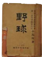
『野球』 1897年 中馬庚 著

1896年5月、一高(第一高等学校)は横浜在住の外国人チームとの試合に29対4で勝利。この勝利が新聞で報じられ、野球人気が全国的に高まった。