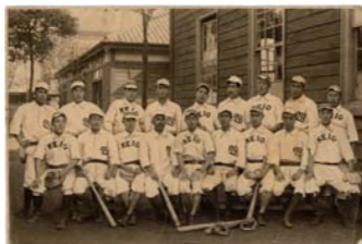
第1回早慶戦出場選手

1903年に早稲田が慶応に試合を申込み早慶戦が始まった。06年、応援の過熱が問題となり中止になる。25年秋に復活、早慶明法立に東大が加盟し東京六大学リーグ戦が始まった。