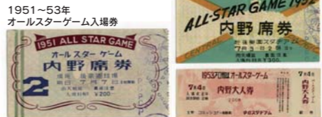
1951~53年 オールスターゲーム入場券